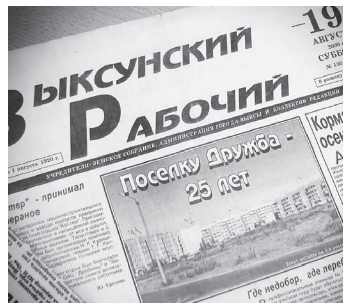
● В августе 2000 года, накануне 25-летия с момента основания Дружбы, «Выксунский рабочий» посвятил специальный иллюстрированный материал посёлку-юбилею