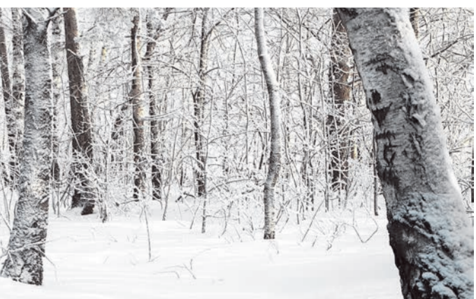
● Посёлок окружён лесным массивом и, безусловно, многие местные жители считают близость к природе большим плюсом – есть где прогуляться на досуге. Во время январского репортажа в близлежащем от Дружбы полдеске можно было наблюдать удивительно живописную картину: все деревья были покрыты белоснежной бахромой инея, а ровное снежное покрывало придало этому пейзажу спокойный и гармоничный вид. Но самое интересное, что этот снимок сделан... всего в 10 метрах от главной дороги, по которой постоянно сплужают легковушки и большегрузные фуры