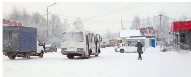
● В районе конечной остановки автобусного маршрута Выкса – Дружба находится большинство местных объектов инфраструктуры. На маленьком пятёчке по обе стороны дороги здесь расположены несколько продовольственных и хозяйственных магазинов, аптека и пр.