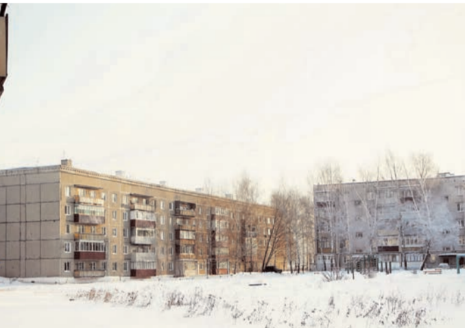
● Близко расположенные друг к другу панельные и кирпичные пятиэтажки, редкие деревья у домов, наличие детских игровых площадок и небольших пустырей – картинка из поселковой жизни очень похожа на привычную в городском микрорайоне