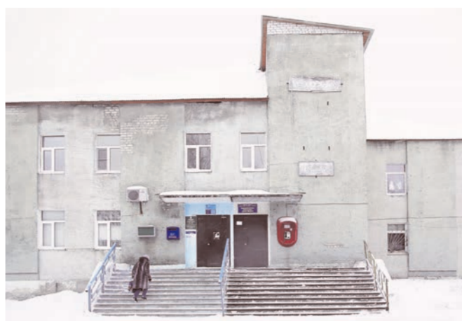
● В этом большом строении находятся несколько общественных поселковых учреждений и организаций. На фото: левая дверь ведёт в отделение Сбербанка и почты, правая – в библиотеку, расположенную на втором этаже. В советские времена при строительстве зданий практически не уделялось внимания возведению пандусов, но, как нетрудно убедиться, на таком высоком крыльце удобная полая площадка для передвижения грузов, инвалидов и детских колясок просто необходима